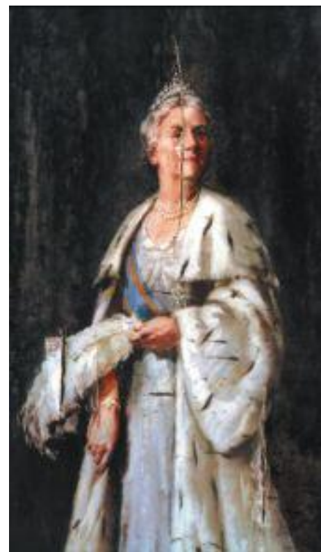
Gert Jan Kocken retrata objectes agredits per actes iconoclastes, com aquest quadre.

De la mateixa manera que Kocken retrata les empremtes del pas-