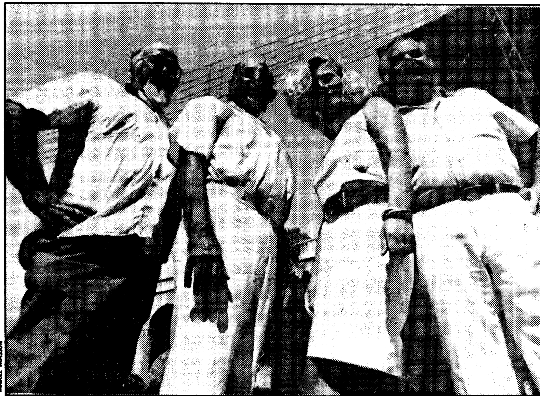
Los Valldemossa forman parte de la historia de la música popular de Mallorca desde principios de los 60

"Tito's", que conserva su ubicación y se ha convertido en una de las discotecas más frecuentadas de Palma, fue el primer local importante donde aquellos jóvenes interpretaron sus canciones. Poco después pasaron a "Tagomago", donde llevaron a cabo una importante labor de promoción, regresaron a "Tito's" y, finalmente, pasaron a "Jack el Negro", donde