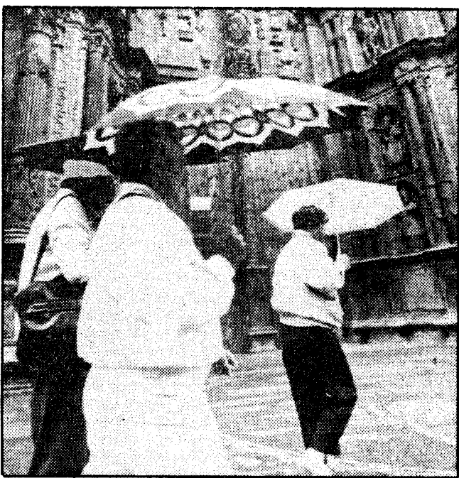
Llegó la lluvia; ¿terminó el verano?