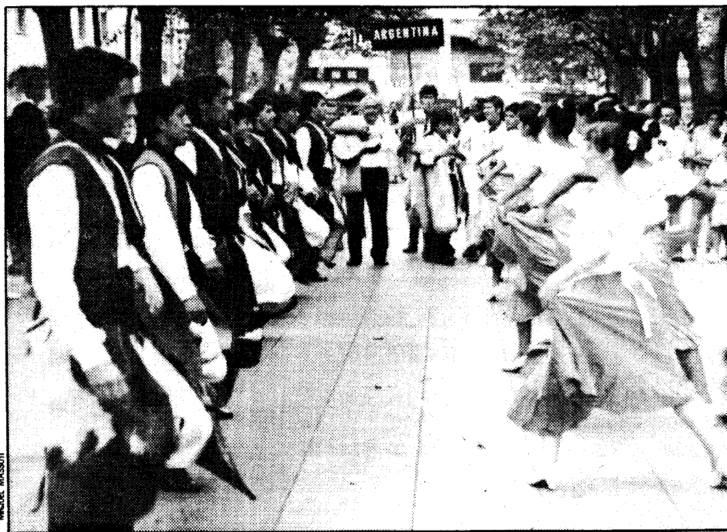
El folklore argentino también estuvo representado en las calles de Palma

El fuerte calor reinante no impidió la actuación de todos los grupos. Una vez en el paseo, cada uno se apoderó de un reducido espacio para ofrecer una muestra