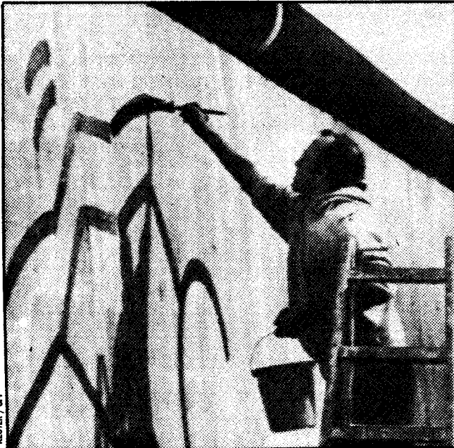
Berlín, el muro, el arte