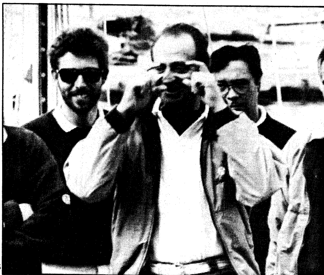
Don Juan Carlos bromea desde el "Bribón VI" ante el asedio de los fotógrafos

El progresivo interés que la vida estival mallorquina ha despertado entre los españoles y la concurrencia de un número cada vez mayor de personajes "vip" de la economía y el espectáculo, ha motivado, este año, que un total de 223 informadores se hayan acreditado en la VII Copa del Rey-Trofeo Agua Brava. De este número, nadie lo discute, una buena parte acuden a la cita atraídos más por las imágenes oportunas de la Familia Real y Mario Conde, la gran novedad de este verano gráfico mallorquín,