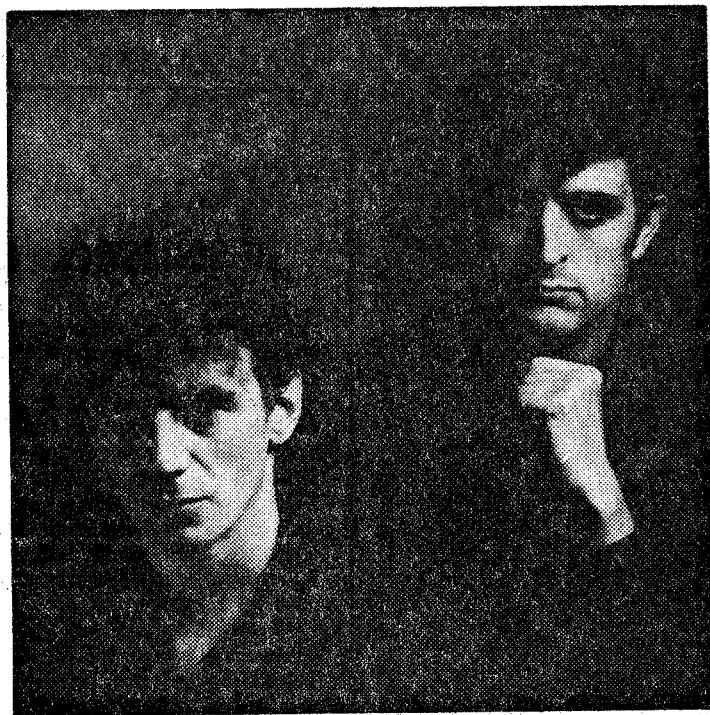
El Último de la Fila